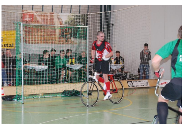
Bilder von der Nationalliga-A Runde vom 29.01.2011 in der Fraumatt-Turnhalle in Liestal